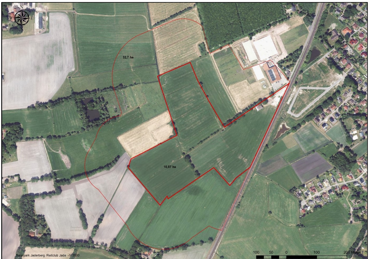
Abbildung 2: Untersuchungsbereich westlich von Jaderberg und westlich der Bahnlinie Oldenburg – Wilhelmshaven.